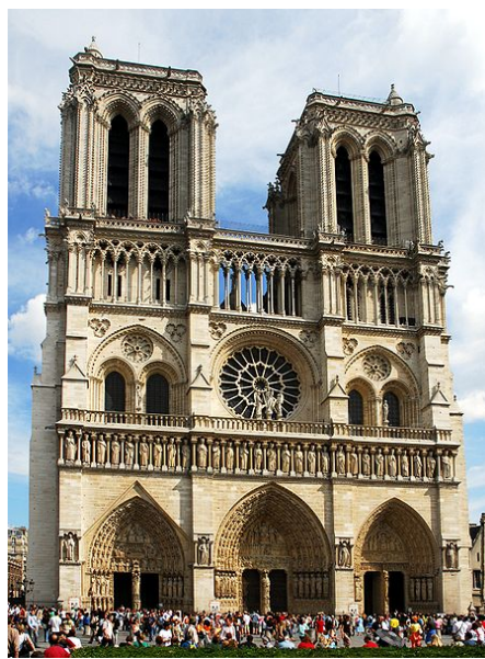
Paris - Notre Dame