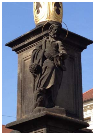
Sv. Bartoloměj – morový sloup, nám. Republiky v Plzni