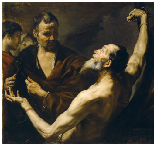
Jusepe de Ribera, Mučednictví sv. Bartoloměje -1634