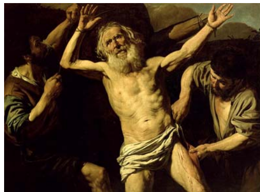
Valentin De Boulogne – Mučednictví sv. Bartoloměje (1. polovina 17. století)