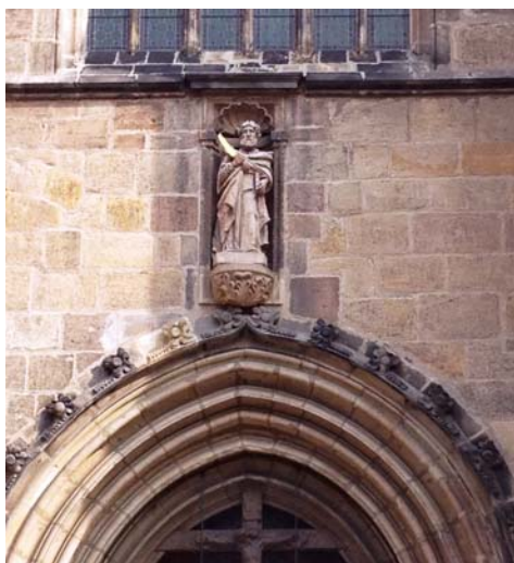
Sv. Bartoloměj - chrám sv. Bartoloměje v Plzni