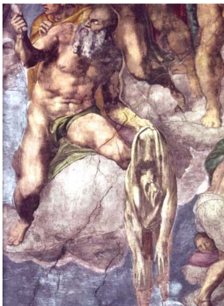
Michelangelo-Sixtinská kaple-Sv. Bartoloměj